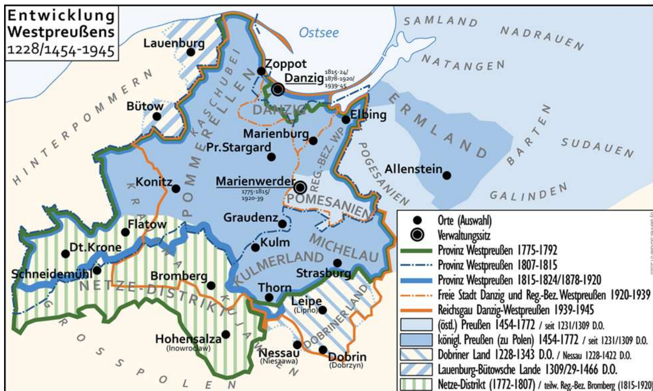
Entwicklung Westpreußens 1228/1454–1945.-

https://commons.wikimedia.org/wiki/File:Entwicklung%CC%A0Westpreussen.png