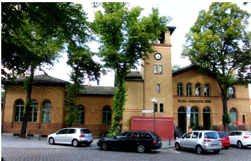
Bürgertreff im Bahnhof Lichterfelde West

Brandenburg Sachsen-Anhalt Mecklenburg Sachsen Pommern Schlesien Westpreußen Böhmen und Mähren Ostpreußen Galizien Baltikum Siebenbürgen Baltische Staaten Tschechien Weißrussland Slowakei Russland Ungarn Ukraine Rumänien Polen Südslawische Staaten