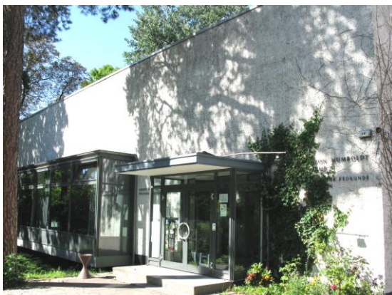
Alexander-von-Humboldt-Haus der Gesellschaft für Erdkunde, Arno-Holz-Straße 14, Steglitz

Magdeburg Leipzig Berlin / Potsdam Görlitz Stettin Breslau Thorn Warschau Marienburg Krakau Danzig Czernowitz Königsberg / Pr. Bukarest Wilna Budapest Riga Wien Reval Pressburg Sankt Petersburg Prag