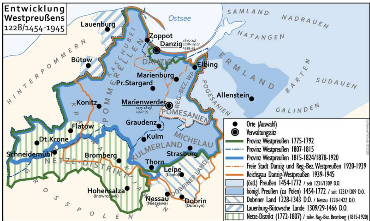
Entwicklung Westpreußens 1228/1454–1945.-

https://commons.wikimedia.org/wiki/File:Entwicklung%CC%A0Westpreussen.png