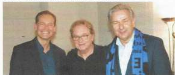
15. Dezember 2014 Backstage nach einem Konzert im Friedrichstadtpalast.

Außenhandelskaufleuten ausgebildet wurden. Beide kehrten danach dem Handel den Rücken zu, wele ein Verlust für die Marktwirtschaft.