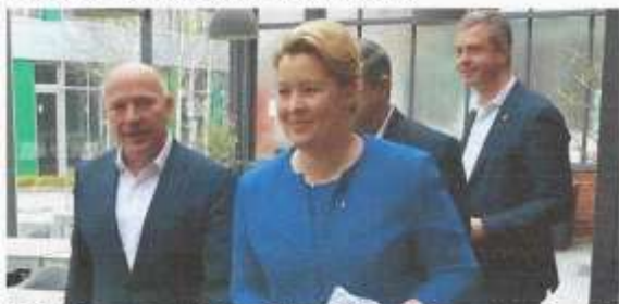
Kai Wegner und Franziska Giffey beim ersten Sondierungsgespräch zur Aufnahme von Koalitionsverhandlungen am 9. März 2023 in der Schmiede des EUREF-Campus.

Am 8. Februar 2023, vier Tage vor der Wiederholungswahl, waren beim Tagesspiegel Kandidaten-Check auf dem EUREF-Campus die Koalitionsmöglichkeiten schon klar. (In Klammern das Wahlergebnis vom 12.02.2023). Die CDU lag in der aktuellen Umfrage mit 25 (28,2) Prozent vorn, gefolgt von SPD 21 (18,4), Grünen 17 (18,4), und Linken 11 (12,2) Prozent. Die Rot-Grün-Rote-Koalition hätte also weiterwurschteln können. Dass die stärkste Partei, die CDU, eine Koalition anführen könnte, hatte damals niemand so richtig auf dem Zettel.