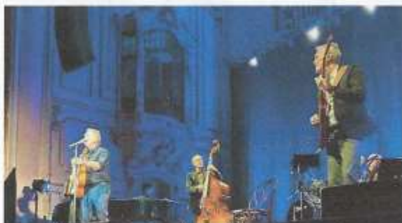
Beim Konzert am 25. November 2024 in der Hamburger Laeishalle.

Klaus Hoffmanns Konzerte sind Wohlfühlmomente, auch wenn es in den Texten keineswegs nur um die heile Welt geht. Klaus Hoffmann gehört zu Berlin wie der 25 Jahre ältere Funkturm.