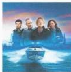
WaPo Bodensee.

Die Auswirkungen auf die Straße von Hormus waren vorhersehbar. Weil er das selbst verschuldete Problem nicht lösen kann, drängt er nun seine Verbündeten, die er ständig beleidigt, verunglimpft und mit maßlosen Zöllen überzieht, ihm zu helfen. Wie erbärmlich ist das denn? Frankreich und Großbritannien sollen einsteigen, ausgerechnet die Länder, deren Präsidenten und Premier Minister er ständig beschimpft. Sogar China soll helfen, ein Land, mit dem er sich in einem Wirtschaftskrieg befindet. Diese Anfragen zeigen, wie dumm dieser Mensch ist.