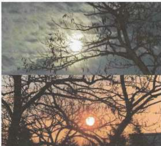
oben: Mondaufgang am 3. März um 19:09 Uhr, Sonnenaufgang am 4. März um 07:06 Uhr, über Mariendorf.

Ein immer wieder schöner Anblick, obwohl man weiß, dass Mond und Sonne im Osten aufgehen, und dort nichts Gutes passiert, weder im ganz nahen noch im Nahen Osten. Was Mond und Sonne schon gesehen haben, bevor sie bei uns aufgehen, ist ein Blick in die Tiefen der menschlichen Abgründe. Ein Lebewesen, dem es so gut gehen könnte, wenn es wollte. Niemand müsste Hunger leiden; es ist genug für alle da. Auch könnte jeder ein zu Hause haben, wenn die biologische Spezies, die wissenschaftlich als Homo sapiens bezeichnet wird, nicht immer wieder alles zerstören würde. Übrigens: Homo sapiens ist lateinisch und bedeutet „verstehender/weiser Mensch“. Was für ein Etikettenschwindel.