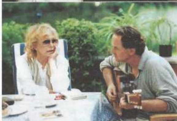
Mit Harald Juhnke und Hildegard Knef

Klaus Hoffmanns Konzerte sind Wohlfühlmomente, auch wenn es in den Texten keineswegs nur um die heile Welt geht. Klaus Hoffmann gehört zu Berlin wie der 25 Jahre ältere Funkturm.