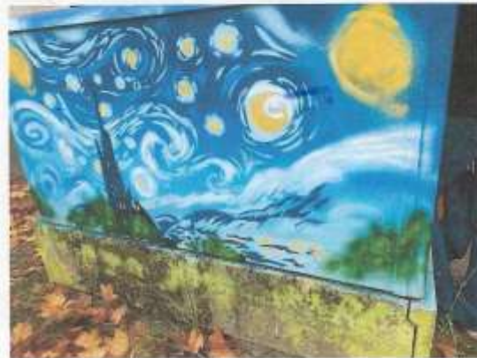
1 (Foto) Julius-Leber-Schule (Reinickendorf) - Motiv: Kunst trifft Strom, Medebacher Weg 36, 13507 Berlin