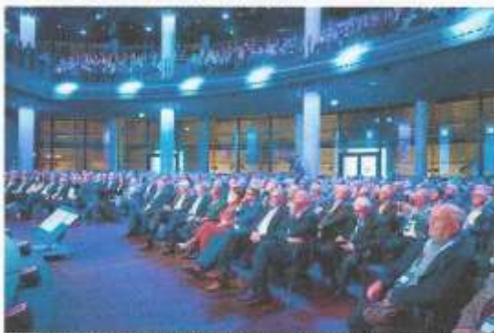
Volles Haus beim Gipfeltreffen im Gasometer.

Wenn der Zugang zum Gasometer auf dem EUREF-Campus von Autos gesäumt wird, friedlich aufgereiht, abwechselnd ein Verbrenner neben einem Elektrofahrzeug, dann findet der Neujahrsgipfel des Zentralverbands des Deutschen Kraftfahrzeuggewerbes (ZDK) statt. Die Autoindustrie ist die eine Seite der Medaille, der ZDK die andere. Und diese andere ist näher an den Menschen, denn unter dem Motto „Wir können Auto“ vertritt der Verband die berufsständischen Interessen von 39.230 Autohäusern, Karosserie- und Kfz-Meisterbetrieben mit 468.000 Beschäftigten und einem Jahresumsatz von 224 Mrd. Euro.