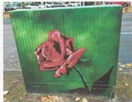
3 (Foto) Paul-Simmel-Grundschule (Tempelhof-Schöneberg) Motiv: Die Rose, Germaniastraße 12-13, 12099 Berlin