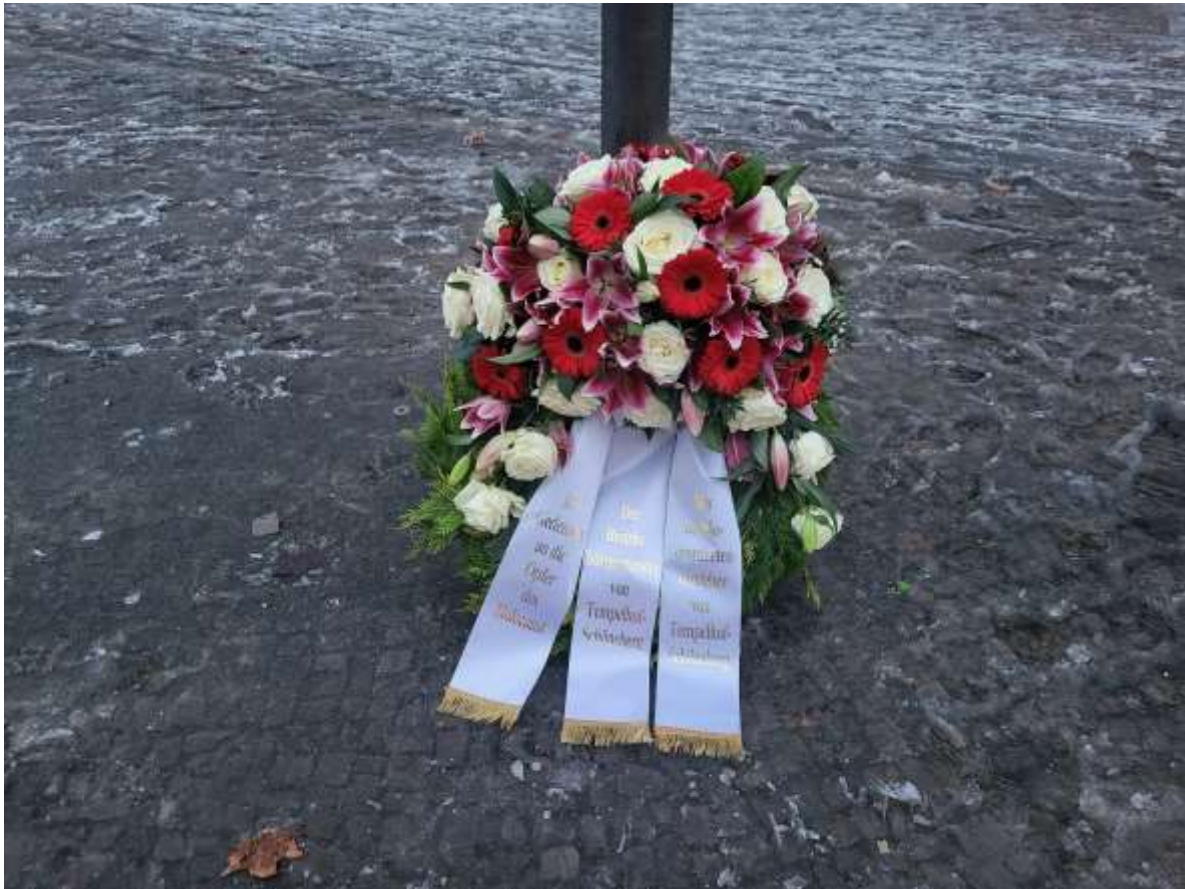
Der Kranz im Gedenken an die Opfer des Holocaust

„Der Holocaust bleibt ein unvorstellbares Verbrechen, das tief in die Geschichte Deutschlands und Europas eingeschrieben ist. Die systematische Vernichtung von Menschenleben durch den Nationalsozialismus ist eine Mahnung, die wir niemals vergessen dürfen. In Tempelhof-Schöneberg setzen wir uns weiterhin für eine lebendige Erinnerungskultur ein, die nicht nur der Vergangenheit gedenkt, sondern auch die Verantwortung für die Gegenwart und Zukunft betont. Angesichts der zunehmenden Bedrohungen durch Antisemitismus und Hass müssen wir uns entschlossen für Demokratie, Vielfalt und Menschlichkeit einsetzen. Die Worte ‚Nie wieder‘ sind nicht nur eine Erinnerung an die Vergangenheit, sondern ein Auftrag für heute und morgen. Gemeinsam können wir ein Zeichen setzen und sicherstellen, dass die Opfer des Holocaust nicht vergessen werden und dass ihre Geschichte uns lehrt, wachsam und engagiert zu bleiben.“