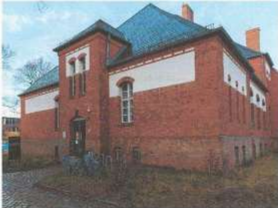
Der Gedenkort auf dem ehemaligen Kasernengelände der Eisenbahnregimenter

Anlässlich des Internationalen Tags des Gedenkens an die Opfer des Nationalsozialismus lädt die SPD Tempelhof-Schöneberg zu einer Gedenkveranstaltung am Sonntag, dem 25. Januar 2026 , ein. Von 14:00 bis 15:30 Uhr findet das Gedenken gemeinsam mit BürgerInnen und Bürgern am Gedenkort SA-Gefängnis Papestraße (Werner-Voß-Damm 54a) statt.