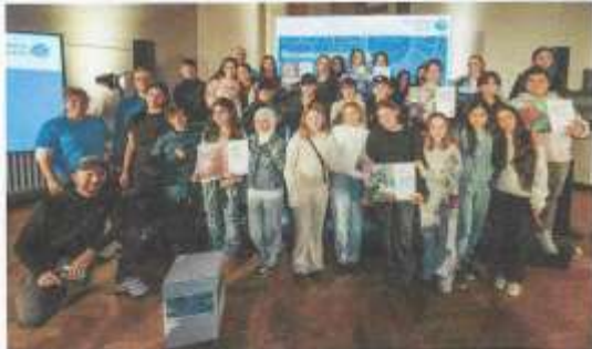
So sehen kreative Sieger aus.

Schätze, Hühner und ganz viel Liebe – Berlins schönste Stromkästen gekürt