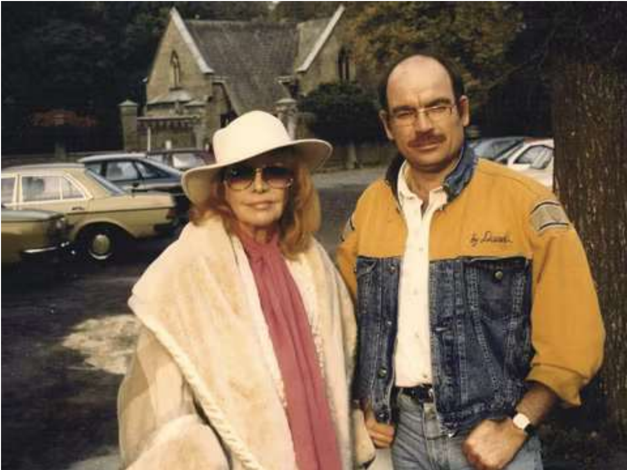
Hildegard Knef und Eberhard Weißbarth.- Bild: Eberhard Weißbarth

Wie bereits vor 10 Jahren findet am Sonntag dem 29. Dezember – dieses Mal unter der Schirmherrschaft von Bezirksstadtrat Aykal – zum 100. Geburtstag von Hildegard Knef in der großen Kapelle auf dem Waldfriedhof Zehlendorf, Wasgensteig 30, 14129 Berlin, wo sie auch begraben liegt, eine feierliche musikalische Gedenkveranstaltung zu ihren Ehren statt. Dazu wird der Film „Hildegard Knef – zwischen gestern und heute“ gezeigt, den Eberhard Weißbarth mit Hildegard Knef zusammen für die ARD 1990 zu ihrem 65. Geburtstag drehte.