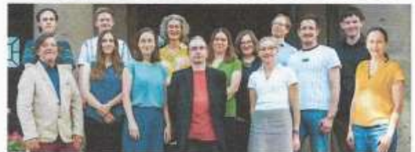
Das ist die Fraktion von Bündnis 90 / Die Grünen in der Bezirksverordnetenversammlung von Tempelhof-Schöneberg

Es gibt kaum ein grüneres Projekt in Berlin als den EUREF-Campus, der die CO 2 -Klimaziele der Bundesregierung für 2045 schon 2014 erreicht hatte. Und es gab keinen größeren Gegner des Vorhabens als ausgerechnet die Grünen in Tempelhof-Schöneberg. Sie behinderten so ziemlich jede Entwicklung auf dem Campus, wodurch es zu Bauverzögerungen kam. Baugenehmigungen mussten teilweise vor Gericht erstritten werden, und die Kosten der Verfahren trug der Bezirk. paperpress 557. 27. 24.09.2018