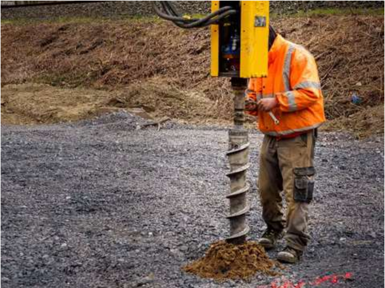
Kampfmittel Sondierung - Bohrgerät im Einsatz.

Die Deutsche Bahn hat das Bezirksamt informiert, dass entlang der alten Potsdamer Stammbahn, welche quer durch Steglitz-Zehlendorf verläuft, bis März 2026 Baugrunduntersuchungen und Kampfmittelsondierungen erfolgen. Im i2030-Teilprojekt Potsdamer Stammbahn+ wird die Wiederinbetriebnahme der historischen Potsdamer Stammbahn untersucht. Die Deutsche Bahn (DB InfraGO AG) führt derzeit im Auftrag der Länder Berlin und Brandenburg die Vorplanung (Leistungsphase 2 gemäß HOAI ) durch.