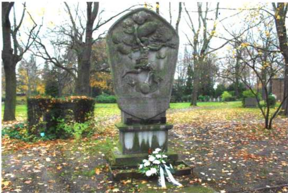
Unser Blumengebilde am Gedenkstein für das 1. Westpreußischen Fußartillerie-Regiment Nr. 11