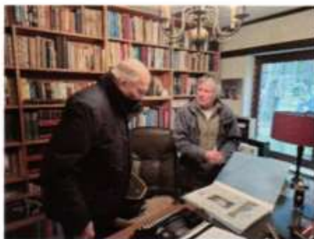
Besuch aus Bremen im Arbeitszimmer