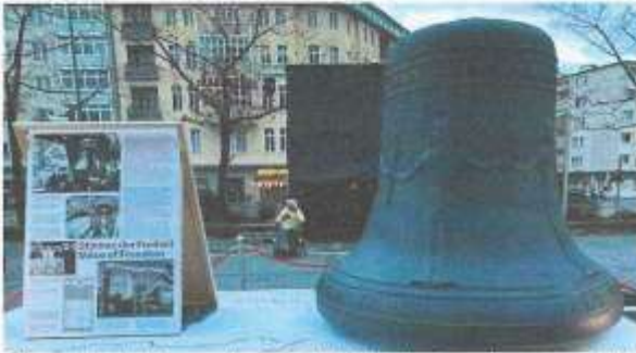
Diese Nachbildung der Freiheitsglocke tourt gegenwärtig durch Berlin

Der Klang der Freiheitsglocke vom Turm des Rathauses Schöneberg ist seit 1950 jeden Tag um 12:00 Uhr eine mahrende Stimme, das Wertvollste, was ein Mensch haben kann, nämlich seine Freiheit, zu bewahren. Freiheit ist nur im Frieden möglich. Fast drei Generationen nach dem Überfall Deutschlands auf Polen am 1. September 1939, hat am 24. Februar 2022 Russland die Ukraine angegriffen. Beide Kriege offenbaren die menschenverachtenden Lust des Angreifers, ein freies, unabhängiges Land zu erobern und die Menschen zu unterjochen. In Polen ist es nicht gelungen und in der Ukraine wird es auch nicht gelingen, denn der Klang der Freiheit ist lauter als der der Tyrannei.