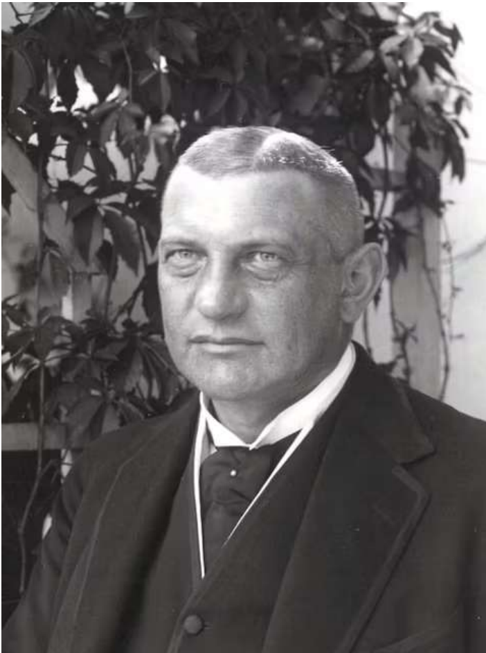
Architekt Heinrich Straumer.

Der Funkturm ist weltbekannt. Aber der Architekt Heinrich Straumer, der das Berliner Wahrzeichen maßgeblich gestaltete, ist heute nahezu unbekannt. Straumer gehörte als Vertreter der gemäßigten Moderne und des Englischen Landhausstils im ersten Drittel des 20. Jahrhunderts zu den renommierten Architekten Berlins. Hauptsächlich in Dahlem, Lichterfelde, Nikolassee und Zehlendorf schuf er zahlreiche Villen und Wohnhäuser.