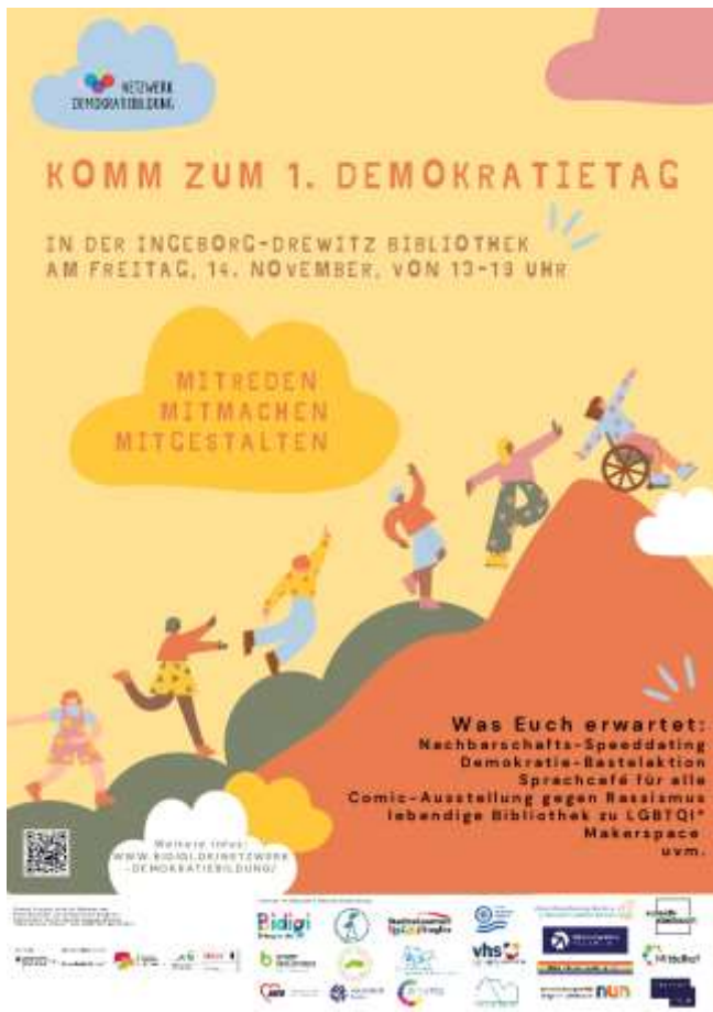
Plakat Demokratietag.

Unter dem Motto „ Mitmachen, Mitreden, Mitgestalten “ lädt das Netzwerk Demokratiebildung zum 1. Demokratietag in die Ingeborg-Drewitz-Bibliothek in Steglitz-Zehlendorf ein. Dieses Projekt wird im Rahmen der Partnerschaft für Demokratie Steglitz-Zehlendorf durch das Bundesprogramm „Demokratie leben!“ des BMBFSFJ gefördert.