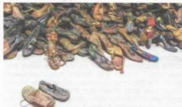
Schuhe ermordeter Juden in Auschwitz

Schirmherr ist Berlins Regierender Bürgermeister Kai Wegner (CDU), der die Ausstellung am Sonntag offiziell eröffnet hatte. Für Besucherinnen und Besucher ist sie ab Dienstag geöffnet.