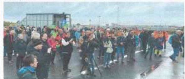
Foto: Die Brückeneinweihung stieß, trotz schlechten Wetters, auf großes Interesse.