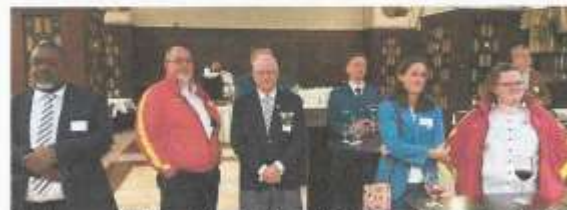
Fehlen auf keinem Bezirksfest: Die Helferinnen und Helfer der DLRG Schöneberg.