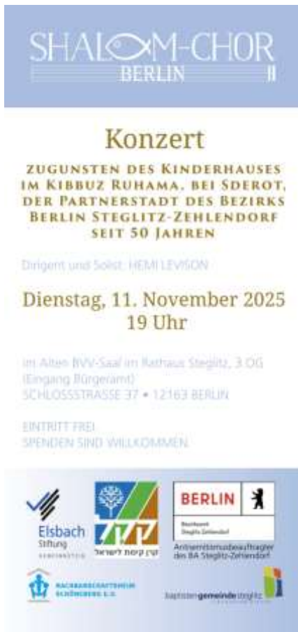
Werbeplakat Benefizkonzert Shalom-Chor Berlin.

Shalom/Salam spiegelt einen Herzenswunsch wider, den kaum jemand mehr verkörpert als der Chor, der ihn im Namen trägt: Unter der Leitung von Kantor Hemi Levison gibt der interreligiöse Shalom-Chor Berlin am 11. November 2025 um 19 Uhr im Alten BVV-Saal des Rathauses Steglitz (Schloßstr. 37, 12163 Berlin, Eingang Bürgeramt, 3. OG) ein Benefizkonzert.