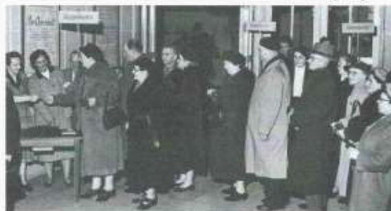
Platzverlosung an die Mitglieder der Freien Volksbühne Berlin in der Kassenhalle des Theaters am Kurfürstendamm, das zwischen 1949 und 1963 Spielstätte des Vereins war. Das genaue Jahr der Aufnahme ist unbekannt.

Die Zeit des Kalten Kriegs und die Wendejahre waren für die Freie Volksbühne von finanziellen Herausforderungen und dem sich wandelnden Freizeitverhalten der Berliner geprägt. Die jüngsten Jahre und die Auswirkungen der Pandemie auf den Kulturbetrieb bilden den Abschluss des historischen Rundgangs.